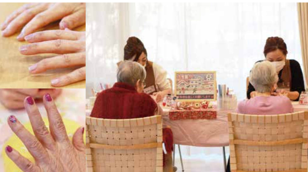
取材に協力してくれたのが、東葛西にある「チャーム東葛西」の入居者様。この日は約10名の予約があり、朝10時から始まった訪問ネイルは途切れることなく、笑い声がフロアに響きます。施術が終わると皆さん笑顔！「キレイにしてもらえると気分が全く違うわよ！」と満面の笑みで話します。

一般社団法人 日本保健福祉ネイリスト協会 (JHWN) のネイリストで、全国で約600名以上在籍しています。ネイルの知識はもちろん、高齢者の心身の特性や、認知症・介護についての知識を学びます。ネイルの力で「癒やし・元気・希望」を感じてもらい、笑顔になっただけことを目的としています。「キレイ！嬉しい！」という感情(人生や生活の質)により、損傷した脳の神経細胞を修復し、認知症の予防・改善に期待ができると研究されています。施術はマニキュアで、ジェルネイルは行いません。アクリル絵の具を使用し、アートを入れることもできます。先日介護施設へ伺った際、もともと鰻屋さんを営んでいた男性が突然鰻の絵を爪に書きたい！と自らの手で親指に書き始めました。とても楽しそうで、これまた絵がお上手で驚きました！ネイルは若い女性だけではなくあります。性別問わず喜んでいただけ、笑顔になるお