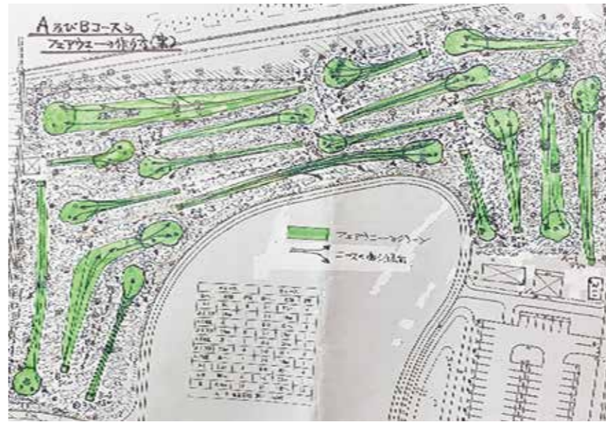
* A及びBコースのフェアウエーの作り方の1案です。

※ 左図は、A及びBコースのフェアウエーの作り方の1案です。 (1) A及びBコースのフェアウエーは海に向かって高く、陸に向かって低く、左右どちらかにも下がっているため、その傾斜に従ってグリーンを狙うショットができるように設定した図面(案)です。