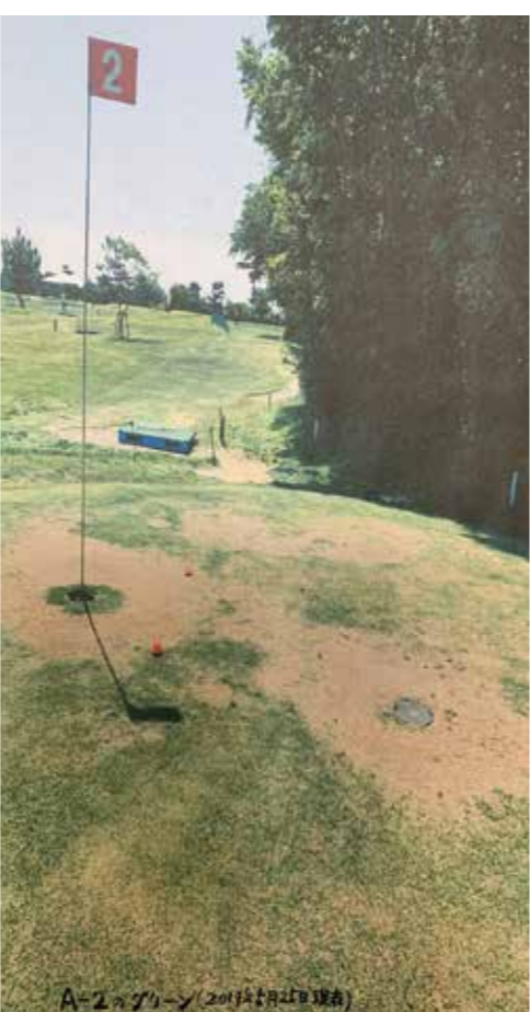
*A-2のグリーン(2019年5月撮影)

ルフもパークゴルフもやったことがない人達ですから（更に、コースの事務所に勤める職員もシルバー人材センターから派遣された高齢者で、日常のコース管理をする具体的な知識も経験もない人達です）、市民スポーツ課からの『このホールはピン穴の周辺の芝がすり切れた部分に砂を蒔いて散水すること』等々の具体的な指示がない限り、どうしていいのか分からない状態でのコース管理だった」ので、コースが荒れているのは当然だったのです。その後、市民スポーツ課ではかなりの努力をして頂き、新しいCコー