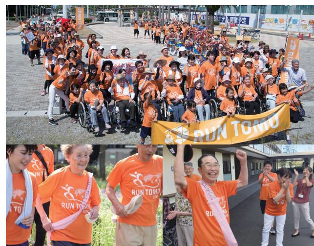
以前開催のRUN 伴うらやすの様子