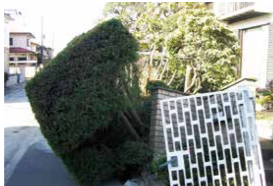
液状化で倒れた我が家の外構

1942年千葉県生まれ。浦安在住歴40年。退職してからは、浦安市郷土博物館の講座「もっと浦安を知ろう」の講師や、市民大学の講師などを歴任。また「ぶらり浦安・ガイド」(浦安街歩きの案内ボランティア)などの経験もあります。趣味は旅行やゴルフ、水彩画なども楽しんでいます。浦安新住民の皆様へ、少しでも楽しくいろいろな浦安を体験して頂きたいと思っています。