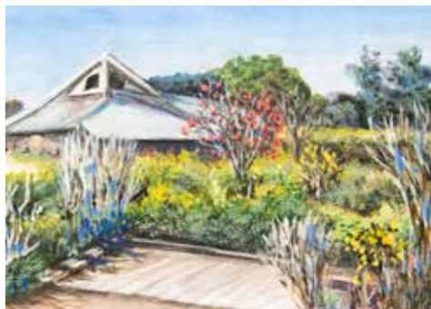
ちょうど冬の時期に描かれたもの。優しい雰囲気の中にも、今にも外の風が吹いてくるような空気感が清々しく感じますね。

そのクラブの一つが「スケッチクラブ」。現在13名のメンバーが第2日曜日に四季の移ろいを楽しみながらスケッチを描いています。年に一度、毎