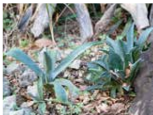
公園の歴史は意外にも浅く、計画 弁天ふれあいの森公園内にある「アオノリュウゼツラン」は冬になっても背が高い姿のまま、まだ踏ん張っていました。後は枯れていだけたそう。写真は「アオノリュウゼツラン」の子どもだそうです！これから40年くらい経てば、また花を咲かせるでしょうか？

がスタートしたのは2000年で、以前は下水処理場と清掃工場だったことを覚えている方も多いのでは。住民と浦安市が協働してその跡地に壮大な公園づくりがスタート。住民たちの夢が詰まったアンケートを元に浦安市と対話を続けながら、計画を練りました。多くの市民が参加し、「夢の公園」の実現を持続的に行うため、有志を中心に2004年に立ち上げたのが、「ふれあいの森公園を育む会」です。現在会には8つのクラブがあり、公園の魅力を維持しながら今も公園づくりに励んでいます。