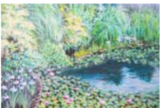
弁天ふれあいの森公園 浦安市弁天 4-13 【ふれあいの森公園を育む会】※留守の場合が多いので留守録にお名前・電話番号をお入れください。「育む会」からご連絡します。※公園へのお問い合わせではありません。

ここだけです。植物の多さもそうだし、豊かな自然を感じられる場所です。人の手によって育まれている『ふれあいの森公園を育む会』のボランティアの方々のおかげで私たちはいつも素敵