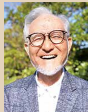
今泉 浩一 Kouichi Imaizumi

■ 著作: 「息子への手紙」「ビジネスで成功する 41 の法則」「副業の不動産投資でお金持ちになり、幸せになる」「日本一学(共著)」「豊かな老後と争わない相続」 ■ 資格: 宅地建物取引士、ファイナンシャルプランナー 2 級、相続アドバイザー 協議会認定上級相続アドバイザー、損害保険代理業普通資格、以上の資格と不動産経営 43 年の街造りの実績で「市民が豊かになる為のセミナー」をボランティアで実施。 ■ 経歴: 1941 年福岡県で生まれる / 1967 年早稲田大学法学部卒 / 1976 年浦安市で不動産業に従事 / 1979 年株式会社明和地所を創業 / 2007 年株式会社明和地所代表取締役を退任し会長に就任 / 2019 年 4 月 株式会社明和地所を退任し、浦安市議会議員選挙に出馬 / 2019 年 4 月 平成 31 年浦安市議会議員選挙に当選 / 2022 年 2 月 闘病中につき浦安市議会議員辞職 / 現在 株式会社明和地所会長